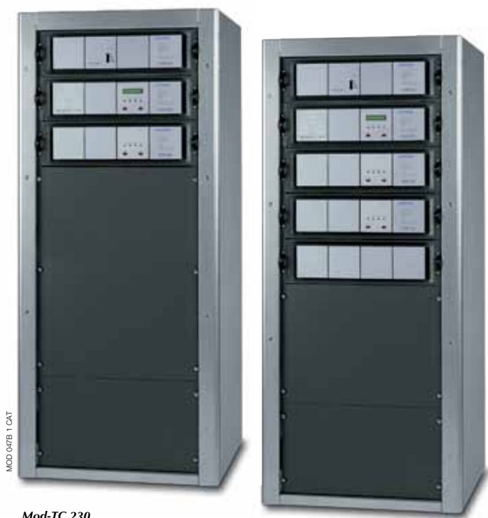
Mod-TC 230 Mod-TC 245 Mod-TC 260